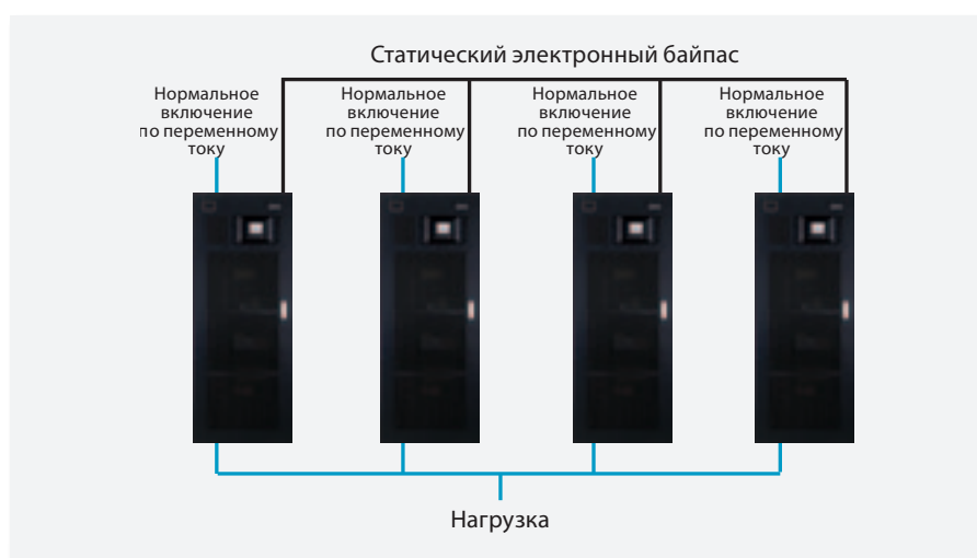
Liebert ® NXC, параллельная конфигурация

Более того, выходы двух одиночных или параллельных устройств Liebert ® NXC могут синхронизироваться. Таким образом, организуется питание на базе двойной шины, что соответствует надежности уровня Tier IV.