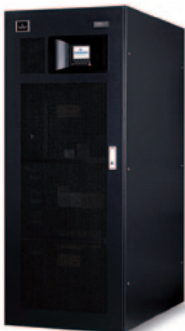
Liebert® NXC, 30–40 кВА