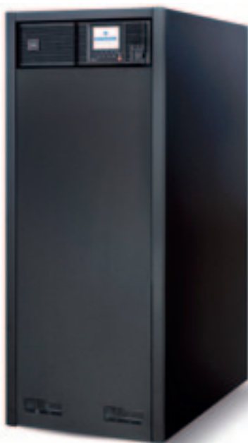
Liebert® NXC, 10–20 кВА

Эти возможности делают Liebert® NXC совместимым с любой системой управления зданием.